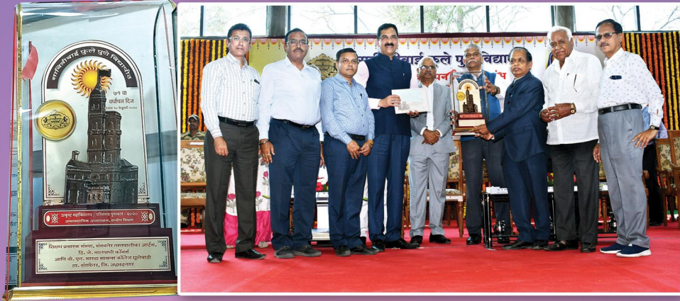
Savitribai Phule Pune University Best College Award 2019