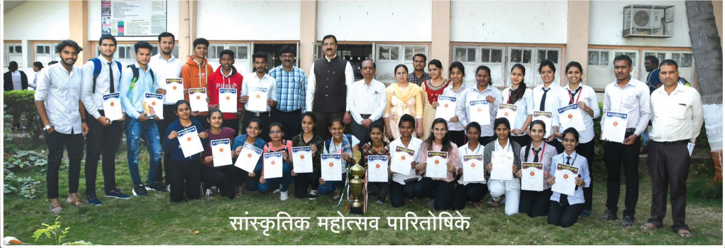
सांस्कृतिक महोत्सव पारितोषिके