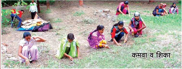
कमवा व शिका