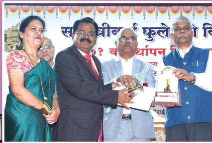
Savitribai Phule Pune University Best Teacher Award 2019