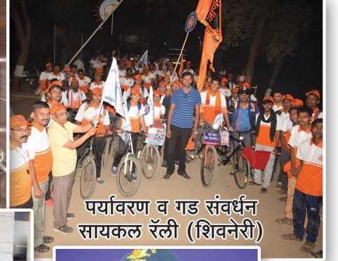
पर्यावरण व गड संवर्धन सायकल रॅली (शिवनेरी)