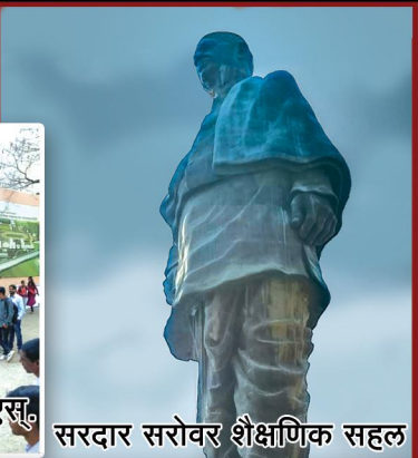
सरदार सरोवर शैक्षणिक सहल